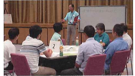
フューチャーセンター