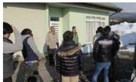
石徹白の産業の一つを知る(農産物加工所)