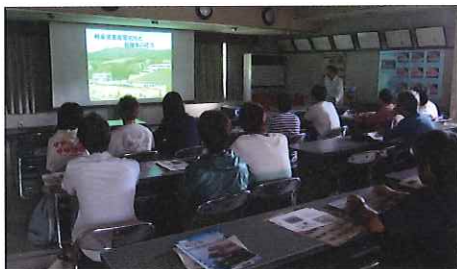
飛騨牛の歴史や現状についての講義(岐阜県畜産研究所)