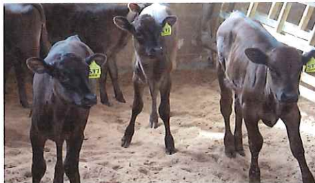
繁殖雌牛や子牛の飼育現場の見学(社)岐阜県農畜産公社)