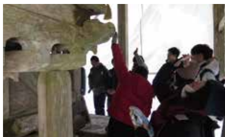
拝殿視察(白山中居神社)