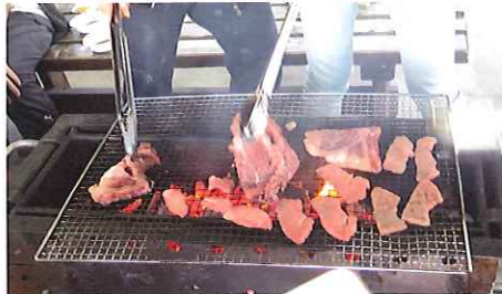
飛騨牛や飛騨豚の試食(食材提供:JA全農岐阜)