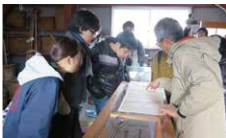
史料を紐解く(石徹白清住邸)