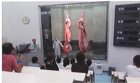
せり場の見学(飛騨ミート)