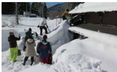
1階部分が雪で覆われた家